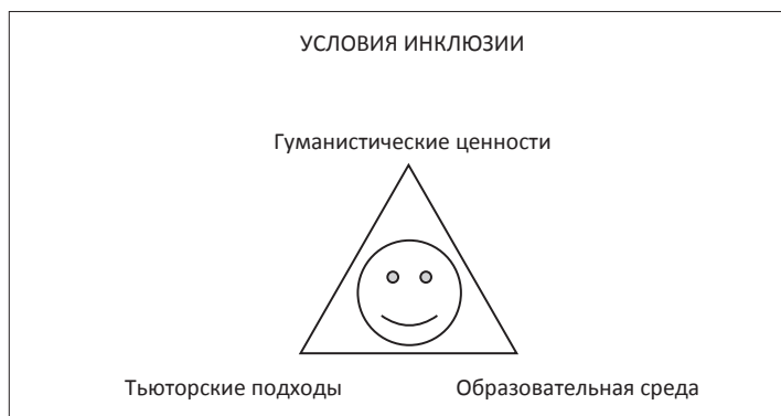
Рисунок 1. Условия инклюзии

Инклюзия обусловлена необходимостью решения таких задач, как: гуманизация российского образования, развитие толерантности в обществе, реализация права детей, подростков и молодёжи с особенностями развития на образование, повышение социальной активности и статуса семей с ребёнком с особенностями развития, внедрение современных практик образования (см. Рисунок 1 ).