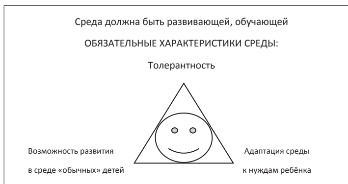
Рисунок 2. Успешная социализация ребёнка с ОВЗ (максимальная самостоятельность и реализация)

Современное состояние экологии и социальной жизни людей, вкупе с достижениями медицины по выхаживанию недоношенных детей и детей с различными нарушениями развития, провоцируют рост числа детей с особенностями развития. Многие говорят сейчас о том, что у нас все дети с особенностями развития. Но если для некоторых детей их особенности не являются критическими в плане самостоятельного получения образования, то для других подбор индивидуальной программы обучения – обязательное условие успешного обучения (см. Рисунок 2 ). В противном случае, ученик может «отсидеть» девять лет в школе и так и не стать достаточно самостоятельным и активным гражданином общества.